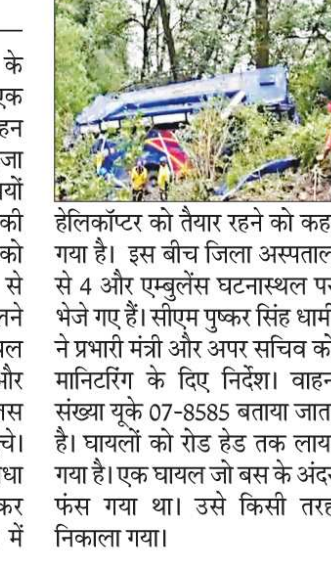
हेलिकॉप्टर को तैयार रहने को कहा गया है। इस बीच जिला अस्पताल से 4 और एंबुलेंस घटनास्थल पर भेजे गए हैं। सीएम पुष्कर सिंह धामी ने प्रभारी मंत्री और अपर सचिव को मानिट्रिंग के लिए निर्देश। वाहन संख्या यूके 07-8585 बताया जाता है। घायलों को रोड हेड तक लाया गया है। एक घायल जो बस के अंदर फंस गया था। उसे किसी तरह निकाला गया।

गंगोत्री राष्ट्रीय राजमार्ग गंगानी के पास एक बड़े सड़क हादसे में एक बस दुर्घटनाग्रस्त हुई है जिस वाहन में लगभग 35 यात्री सवार बताए जा रहे हैं जिसमें से 19 घायल यात्रियों को निकाला गया है। 7 यात्रियों की मृत्यु होनी बताई गई है। घायलों को उपचार हेतु 108 एंबुलेंस से अस्पताल भेजा गया। घटना स्थल के बाद जिलाधिकारी घटना स्थल के पहुंचे। घटना स्तर पर खोज और बचाव कार्य जारी है। पुलिस अधीक्षक भी घटना स्थल पर पहुंचे। घायलों को तुरंत चिकित्सीय सुविधा उपलब्ध कराने को लेकर आवश्यकता पड़ने पर देहादून में