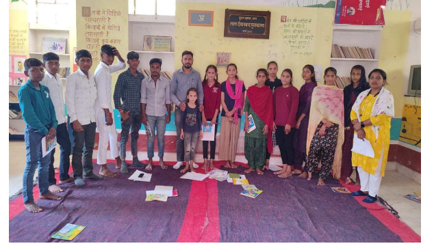
बाप/कविकान्त खत्री/चमकता राजस्थान

दूसरा दशक परियोजना द्वारा रविवार को युवा मंचों के सदस्यों के साथ बाप, फलोदी, शेखासर व चारणाई में समीक्षा बैठकों का आयोजन किया गया। कार्यक्रम प्रभारी इकबाल मेहर ने बताया की बैठक में युवा मंचों द्वारा पूर्व में किये कार्यों की समीक्षा की गयी, जिसमें किचन गार्डन, पक्षियों के लिए परिण्डे लगाना, झोला पुस्तकालय व अमन युवा मंच चारणाई द्वारा सेनेटरी नेफकिन के उपयोग को लेकर किए गए प्रोजेक्ट का प्रस्तुतिकरण किया गया। दूसरा दशक की बशिरों ने बताया कि युवा मंच के सदस्य गांव स्तर पर प्रोजेक्ट बनाकर कार्य कर सकते हैं। इसके अलावा आगामी कार्यों का नियोजन करते हुए गांव स्तर पर राजस्थान स्टेट ओपन का प्रचार प्रसार, किचन गार्डन, स्कूल में नामांकन बढ़ाना, पक्षियों के लिए परिण्डे, वृक्षारोपण, मौसमी बीमारियां से बचाव के लिए टांकों में मीठा तेल डालना आदि काम हाथ में लिए गए।