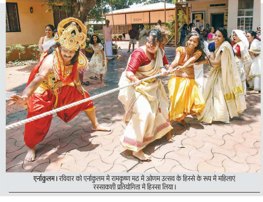
एर्नाकुलम। रविवार को एर्नाकुलम में रामकृष्ण मठ में ओणम उत्सव के हिस्से के रूप में महिलाएं रस्साकशी प्रतियोगिता में हिस्सा लिया।