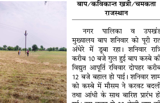
बाप