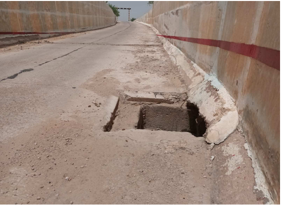
बाप/कविकान्त खत्री/चमकता राजस्थान

उपखंड मुख्यालय बाप से मंडोर जाने वाली डामर सड़क पर बने रेलवे के अंडर ब्रिज में पानी निकासी के लिए लगाए गए पाइप पर लगी हुई लोहे की जालियां अज्ञात चोर चुरा ले गए हैं। अब अंडर ब्रिज के दोनों तरफ बने हुए गड्ढे खुले पड़े हैं। यह खुले पड़े गड्ढे हर पल हादसे को निमंत्रण दे रहे हैं। प्राप्त जानकारी के अनुसार करीब एक माह से यह दोनों हाल गड्ढे खुले पड़े हैं। पूर्व में इनके ऊपर लोहे की जालियां लगी हुई थीं, जिसके कारण ऊपर से वाहन आसानी से निकल जाते थे। अब रात्रि के समय इन खुले पड़े गड्ढे से कभी भी बड़ा हादसा घटित हो सकता है। रेलवे विभाग के जिम्मेदारों को इस तरफ ध्यान देकर खुले पड़े गड्ढे पर पुनः लोहे की जालियां लगवानी चाहिए। यही हाल बाप से नमक उत्पादन क्षेत्र रिण जाने वाली सड़क पर कॉलेज के आगे बने हुए रेलवे अंडर ब्रिज का है। यहां पर भी पानी निकासी के लिए लगाए गए पाइप पर गड्ढे खुले पड़े हैं।