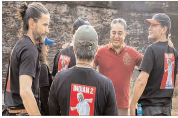
आप नए पोस्टर में कमल हासन व्हाइट कुर्ता और लुंगी में नजर आए हैं। साथ ही पोस्टर पर लिखा है कि ये मूवी जून 2024 में सिनेमाघर पहुंचने वाली है। हालांकि मेकर्स ने किसी तय तारीख का खुलासा अभी तक नहीं किया है। मगर तमिल फिल्मी गलियारों से उड़ती-उड़ती खबरों की मानें तो ये मूवी 12 जून को सिनेमाघर पहुंच सकती है। लंबे वक्त से बनी रही सुपरस्टार कमल हासन की मधुअपेटेड पैन इंडिया रिलीज फिल्म 'इंडियन 2' को मेकर्स ने मोटी लागत से बनाया है। इस फिल्म का प्रोडक्शन पिछले करीब 4-5 साल से चल रहा है। बार-बार फिल्म की शूटिंग रुकने और मेकिंग में लगते लंबे वक्त की वजह से इसकी मेकिंग फॉर पर भी खासा असर पड़ा है। रिपोर्ट्स की मानें तो लायका प्रोडक्शन कंपनी के बैनर तले बनी निर्देशक शंकर की इस फिल्म को करीब 250 करोड़ रुपये की लागत से बनाया गया है। जो एक बेहद बड़ी रकम है। ऐसे में इस फिल्म के लिए जरूरी होगा ये सिनेमाघरों में जबरदस्त प्रदर्शन करे। हालांकि कमल हासन की फिल्मों के बढ़ते क्रेज को देखकर लगता है मूवी ये माइलस्टोन जल्दी ही पार कर लेगी।

कॉलीवुड सुपरस्टार कमल हासन की अपकमिंग सोशल ड्रामा फिल्म 'इंडियन 2' का दर्शकों को बेसब्री से इंतजार है। इस फिल्म को लेकर लंबे वक्त से कयासों का दौर जारी है। निर्देशक शंकर के निर्देशन में बनी यह फिल्म 23 साल पहले सिनेमाघरों में आई इसी जोड़ी की ब्लॉकबस्टर फिल्म 'इंडियन' का सीकवल है। पिछली फिल्म की तरह ही इस फिल्म में कमल हासन एक बार फिर देश की समस्याओं का मुद्दा उठाने वाले हैं। तमिल स्टार कमल हासन की मूवी 'इंडियन 2' की रिलीज को लेकर काफी लंबे वक्त से चर्चाएं चल रही थीं। मगर आधिकारिक तौर पर फिल्म की रिलीज डेट सामने नहीं आ पा रही थी। अब मेकर्स ने लंबे इंतजार के बाद 'इंडियन 2' की रिलीज डेट का खुलासा कर दिया है। 'इंडियन 2' की रिलीज डेट ने तहलका मचा दिया है। इस मूवी की निर्माता कंपनी ने एक धमाकेदार नया पोस्टर जारी कर कमल हासन की फिल्म 'इंडियन 2' की रिलीज डेट का धांसू एलान किया है। सामने