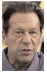
इस्लामाबाद। पाकिस्तान की जेल में बंद पूर्व प्रधानमंत्री इमरान खान ने कहा है कि उनकी पार्टी के कुछ नेता शक्तिशाली सैन्य प्रतिष्ठान के संपर्क में हैं। उन्होंने अपनी पार्टी पाकिस्तान तहरीक-ए-इंसाफ पर कारवाई के बीच किसी से भी वार्ता करने की इच्छा व्यक्त की है। 'डॉन' अखबार की खबर के अनुसार, खान ने यह टिप्पणी शनिवार को अल-कादिर ट्रस्ट भ्रष्टाचार मामले की सुनवाई के बाद पत्रकारों से बातचीत के दौरान की। खान (71) ने कहा कि वह देश के लिए किसी से भी बातचीत करने को तैयार हैं। पाकिस्तान तहरीक-ए-इंसाफ के संस्थापक इमरान खान ने कहा कि यदि वह सेना के पूर्व प्रमुख कमर

जयदे बाजवा के साथ बातचीत कर सकते हैं, तो वह देश के किसी भी व्यक्ति से मुलाकात कर सकते हैं। खान ने बाजवा पर अप्रैल 2022 में उनकी सरकार को गिराने में महत्वपूर्ण भूमिका निभाने का आरोप लगाया था। खान ने कहा कि उनकी पार्टी के कुछ नेता बातचीत के लिए अभी भी (सं = य) प्रतिष्ठान के संपर्क में हैं। उन्होंने हालांकि इस संबंध में विस्तार से नहीं बताया। उन्होंने यह भी दावा किया कि उनकी पार्टी को मिला जनादेश चुरा लिया गया है और पार्टी पर कब्जा करने के प्रयास किए जा रहे हैं। शक्तिशाली सेना से विवाद के बाद