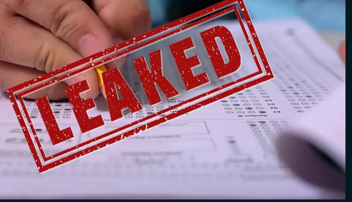
युवाओं में नाराजगी है तो दूसरी तरफ विपक्ष ने भी इस मामले को लेकर जोरदार हमला जारी रखा है। इसको देखते हुए योगी सरकार ने जिस तरफ माफिया, अपराधियों

के खिलाफ मुहिम चलाई थी; वैसे ही कार्रवाई अब नकल-पेपर लीक और सॉल्वर गैंग से जुड़े लोगों पर होगी। अध्यादेश के तहत पेपर लीक में आरोपी पाए जाने पर दो साल से लेकर उम्रकैद की सजा का प्रावधान किया गया है। इसके अलावा एक करोड़ का जुर्माना भी देना पड़ेगा। आज हुई बैठक में पेपर लीक से जुड़े प्रस्तावों पर मुहर लगी। गौरतलब है कि पिछले दिनों ही मुख्यमंत्री की तरफ से पेपर लीक को लेकर सख्त कार्रवाई के आदेश दिए गए थे। पेपर लीक के खिलाफ सख्त कानून, सरकार कई दिन से कर रही थी तैयारी