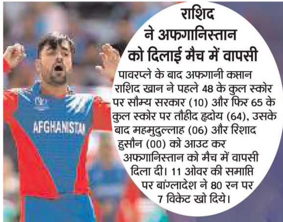
राशिद ने अफगानिस्तान को दिलाई मैच में वापसी पावरप्ले के बाद अफगानी कप्तान राशिद खान ने पहले 48 के कुल स्कोर पर सोम्य सरकार (10) और फिर 65 के कुल स्कोर पर तीहीद हदय (64), उसके बाद महमुदुल्लाह (06) और रिशाद हुसैन (00) को आउट कर अफगानिस्तान को मैच में वापसी दिला दी। 11 ओवर की समाप्ति पर बांग्लादेश ने 80 रन पर 7 विकेट खो दिये।