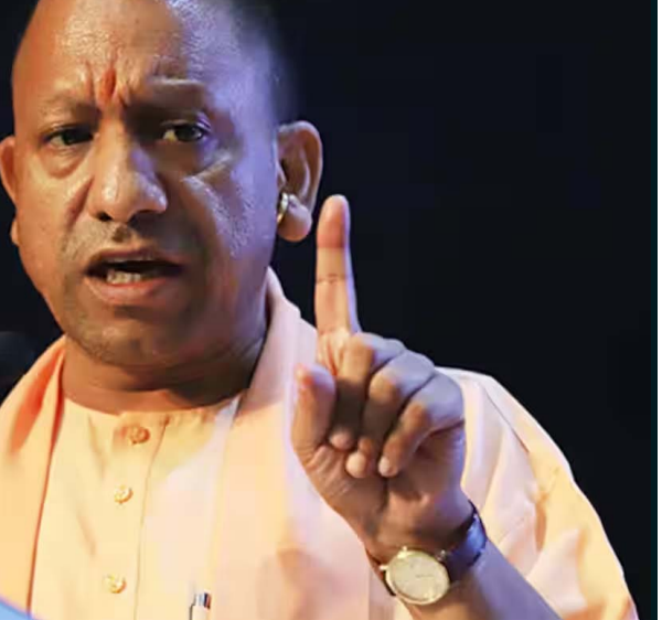
×फरवरी में सूची पुलिस की सिपाही भर्ती परीक्षा और उससे पहले आरओ और एआरओ का पेपर लीक हुआ था। तभी से यह संकेत मिलने लगे थे कि सरकार जल्द ही पेपर लीक के खिलाफ सख्त कानून लेकर आ सकती है। अब अध्यादेश के जरिए सरकार पेपर लीक के खिलाफ नया कानून लेकर आ रही है।

के खिलाफ मुहिम चलाई थी; वैसे ही कार्रवाई अब नकल-पेपर लीक और सॉल्वर गैंग से जुड़े लोगों पर होगी। अध्यादेश के तहत पेपर लीक में आरोपी पाए जाने पर दो साल से लेकर उम्रकैद की सजा का प्रावधान किया गया है। इसके अलावा एक करोड़ का जुर्माना भी देना पड़ेगा। आज हुई बैठक में पेपर लीक से जुड़े प्रस्तावों पर मुहर लगी। गौरतलब है कि पिछले दिनों ही मुख्यमंत्री की तरफ से पेपर लीक को लेकर सख्त कार्रवाई के आदेश दिए गए थे। पेपर लीक के खिलाफ सख्त कानून, सरकार कई दिन से कर रही थी तैयारी