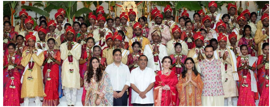
अंबानी परिवार की ओर से प्रत्येक जोड़े को मंगलसूत्र, शादी की अंगुठी और नाक की लोंग सहित सोने-चांदी के कई आभूषण भेंट किए। इसके अलावा, प्रत्येक दुल्हन को 'स्त्रीधन' के रूप में 1 लाख 1 हजार रुपये का चेक भी दिया गया। प्रत्येक जोड़े को एक वर्ष के लिए पर्याप्त किराने और घरेलू सामान भी उपहार में दिए गए, जिसमें 36 प्रकार की आवश्यक वस्तुएं जैसे बर्तन, गैस स्टोव, मिक्सर, गैरे, तर्किंग आदि शामिल थे। सामूहिक विवाह में उपस्थित लोगों के लिए एक भव्य भोजन का आयोजन भी किया गया। शाम को हुए एक सांस्कृतिक कार्यक्रम में वारली जनजाति द्वारा पारंपरिक तरपा नृत्य प्रस्तुत किया गया। बताते चलें कि अंबानी परिवार हर बड़े पारिवारिक कार्यक्रम की शुरुआत मानव सेवा से करता है। पहले भी परिवार में शादियों के अवसर पर, अंबानी परिवार ने आस-पास के समुदायों और गैर सरकारी संगठनों के साथ मिलकर लोगों के लिए भोजन सेवा या अन्न सेवा चलाई थी।

मुंबई। अनंत अंबानी और राधिका मर्चेंट के शादी की रस्मों की शुरुआत गरीब कन्याओं के सामूहिक विवाह से हुई। वंचित परिवारों से जुड़े 50 से अधिक जोड़े मुंबई से कोई 100 किलोमीटर दूर पालघर से आए थे। सामूहिक विवाह का आयोजन रिलायंस कॉर्पोरेट पार्क में किया गया। इस सामूहिक विवाह में वर व वधू पक्ष के करीब 800 लोग शरीक हुए। इस मौके पर अंबानी परिवार ने ऐसे कई सामूहिक विवाह करवाने का संकल्प लिया। सामूहिक विवाह के अवसर पर नेता अंबानी व मुकेश अंबानी अपने परिवार के सदस्यों के साथ शामिल हुए। नव विवाहितों को अंबानी परिवार ने शुभकामनाएं दी।