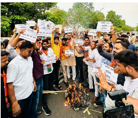
को सार्वजनिक रूप से हिन्दूओं के खिलाफ दिए गए इस बयान को वापस लेते हुए माफी मांगनी चाहिए। राहुल गांधी के बयान के