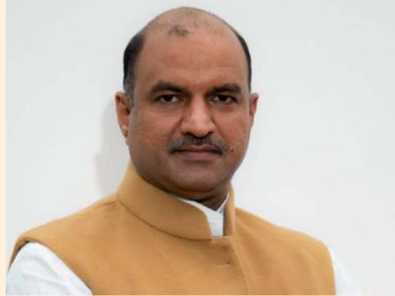
प्रधानमंत्री नरेंद्र मोदी के प्रति जनता का विश्वास है। इसलिए लगातार तीसरी बार देश में प्रधानमंत्री नरेंद्र मोदी के नेतृत्व में सरकार बनी है। प्रदेश के विधानसभा चुनाव में भाजपा ने

भरी हुई है, क्योंकि आम चुनाव के समय विपक्षी पार्टियों ने जनता को गुमराह कर जो भ्रम पैदा किया था वह अब निकल चुका है। राहुल गांधी को प्रश्न कहीं और से आते हैं वो तो एक मोहरा है। कांग्रेस के नेता जब सर्जिकल स्ट्राइक होती है तो पाकिस्तान से कहते हैं कि पीएम मोदी को हटाने के लिए आप मदद करिए। जिन लोगों को देश की जनता पर विश्वास नहीं और दुश्मन राष्ट्र के ऊपर विश्वास है तो देश की जनता उनको कभी बर्दाश्त नहीं कर सकती है। भाजपा प्रदेश अध्यक्ष सीपी जोशी ने कहा कि भाजपा और