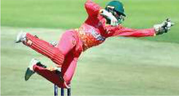
आयरलैंड में टेस्ट के लिए जिम्बाब्वे टीम