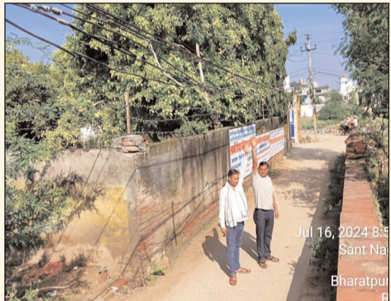
Jul 16, 2024 8:5 Sant Na Bharatpu

विद्युत विभाग की घोर लापरवाही के कारण हो सकता है बड़ा हादसा