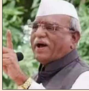
हरिभाऊ किसनराव बागडे

महाराष्ट्र विधानसभा के पूर्व विधानसभा अध्यक्ष हरिभाऊ किसनराव बागडे को राजस्थान का नया राज्यपाल नियुक्त किया गया। हरिभाऊ बागडे कलराज मिश्र की जगह लेंगे। राष्ट्रपति भवन ने शनिवार रात को बताया कि ये नियुक्ति उनके संबंधित कार्यालय का कार्यभार संभालने की तारीख से