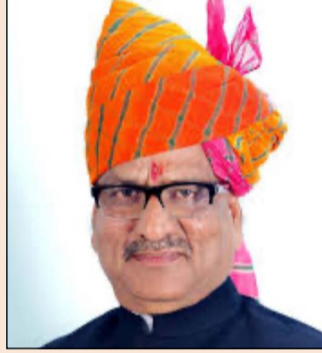
ओम प्रकाश माथुर

प्रभावी होंगे। झारखंड समेत कई राज्यों के राज्यपाल और पुडुचेरी में उपराज्यपाल की नई नियुक्ति को मंजूरी मुर्मू ने महाराष्ट्र, पंजाब, राजस्थान, तेलंगाना,