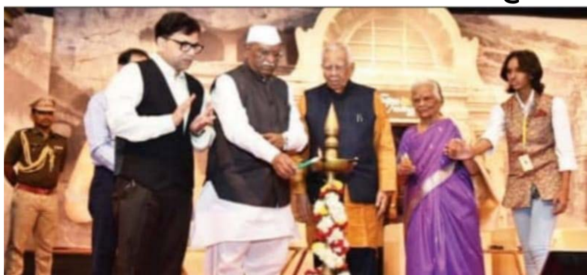
छत्रपति संभाजी नगर में ज्ञानयज्ञ फाउंडेशन द्वारा आयोजित तृतीय पद्म फेस्टिवल के उद्घाटन समारोह में संबोधित कर रहे थे। उन्होंने लहरों से उदक नौका पार नहीं होती, कोशिश करने वालों की हार नहीं होती कविता पंक्तियां सुनाते हुए कहा कि जीत उन्हीं की