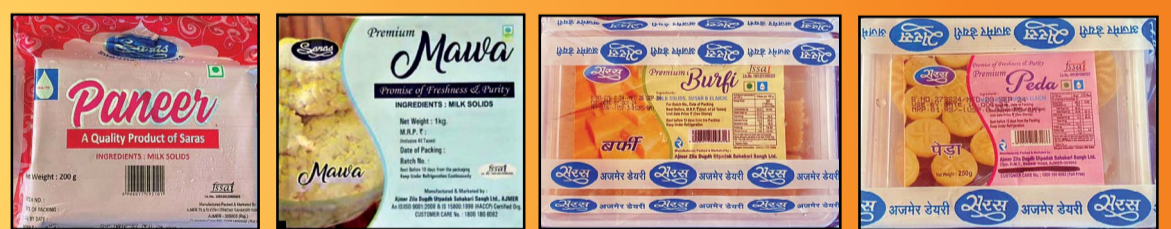
पनीर, फीका मावा, बर्फी, पेड़ा 200 ग्राम एवं 1 कि.ग्रा., 200 ग्राम एवं 1 कि.ग्रा., 250 ग्राम एवं 500 ग्राम, 250 ग्राम एवं 500 ग्राम पैकिंग में उपलब्ध