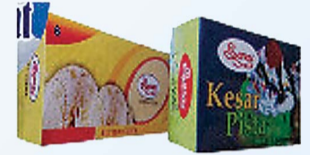
आईसक्रीम ब्रिक फैमिली पैक वनीला, केसर पिस्ता, स्ट्रॉबेरी, बटर स्कोव फ्लेवर्स