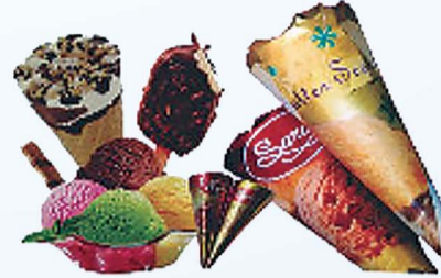
कोन आईसक्रीम, बटर स्कोव, चॉकलेट, वनीला, स्ट्रॉबेरी फ्लेवर्स