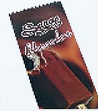
कैंडी, चॉकलेट, मँगो, अरिज, रोज