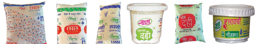
सादा छाछ, नमकीन छाछ, लस्सी, दही (कप), दही (पाउच), श्री खण्ड 500 मि.ली., 200 मि.ली., 200 मि.ली., 200 ग्राम, 500 ग्राम, 100 ग्राम / 500 ग्राम पैकिंग में उपलब्ध