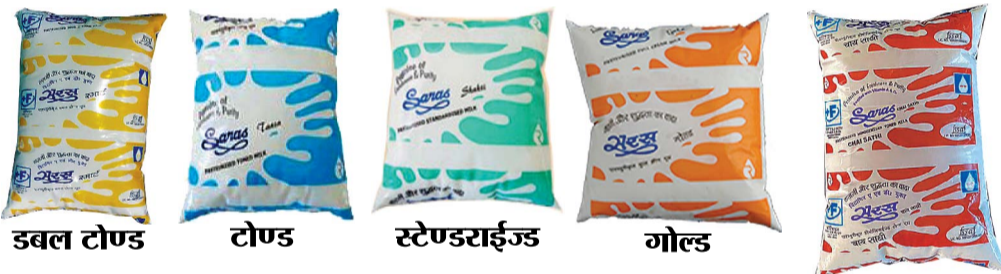
डबल टोण्ड, टोण्ड, स्टेण्डराईज्ड, गोल्ड, चाय साथी 200 मि.ली., 1/2 लीटर, 1 लीटर एवं 6 लीटर पैकिंग में उपलब्ध