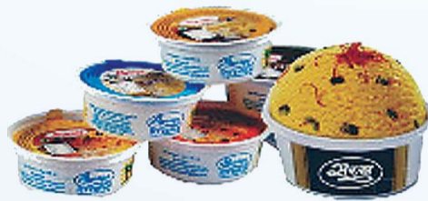
बटर स्कोव, केसर पिस्ता, काजू दबा, चॉकलेट, वनीला, स्ट्रॉबेरी फ्लेवर्स