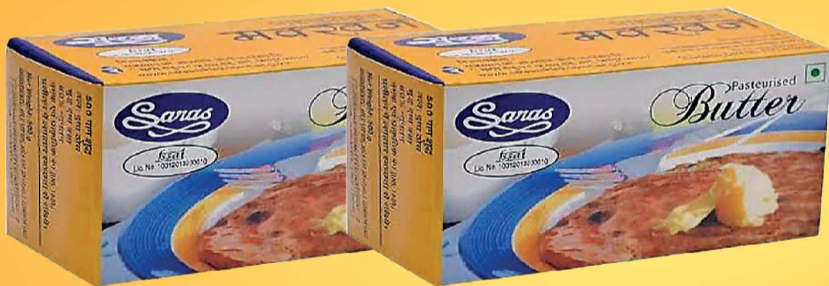
बटर - 100 ग्राम, 500 ग्राम व्हाइट बटर - 15 कि.ग्रा. के स्लेब्स में उपलब्ध