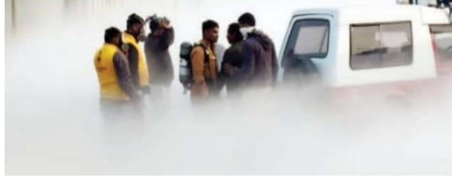
मेन वॉल बंद कर रोक़ी गैस लीकेज

गैस लीकेज के चलते स्थानीय लोगों में दहशत का माहौल फैल गया। विश्वकर्मा थाना पुलिस सूचना पर फायर ब्रिगेड की गाड़ी के साथ मौके पर पहुंची। पुलिस ने ऑक्सीजन प्लांट के मेन वॉल को बंद करवाकर लीकेज को बंद करवाया। ऑक्सीजन गैस के लीकेज से पारदर्शिता कम होने के चलते वाहनों को पुलिस ने धीमे गति से हटवाया। फायर ब्रिगेड की मदद से पानी के बाछोर कर गैस के लेवल को हटाया गया। पुलिस ने हादसे में किसी के हाताहत होने से मना किया है।