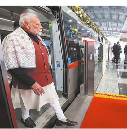
कहा, देश विकसित भारत की संकल्पसिद्धि में जुटा रेलवे इंफ्रास्ट्रक्चर में आया बड़ा बदलाव

प्रधानमंत्री नरेंद्र मोदी ने कहा कि आज देश विकसित भारत की संकल्पसिद्धि में जुटा है और इसमें भारतीय रेलवे का विकास अहम है। पिछला एक दशक भारतीय रेलवे के ऐतिहासिक परिवर्तनों का रहा है। अब वह समय दूर नहीं है जब जल्द ही देश में बुलेट ट्रेन दौड़ेगी। प्रधानमंत्री सोमवार को वीडियो कॉन्फ्रेंसिंग के माध्यम से नए जम्मू रेलवे मंडल और तेलंगाना में चरलापल्ली स्थित नए टर्मिनल स्टेशन के उद्घाटन तथा ईस्ट कोस्ट रेलवे के रायगढ़ा रेलवे मंडल भवन के शिलान्यास करने के बाद संबोधित कर रहे थे। प्रधानमंत्री ने कहा कि पिछला एक दशक भारतीय रेलवे के ऐतिहासिक परिवर्तनों का रहा है। रेलवे इंफ्रास्ट्रक्चर में एक बड़ा बदलाव आया है। आज देश विकसित भारत की संकल्पसिद्धि में जुटा है और इसमें भारतीय रेलवे का विकास अहम है। इससे देश की छवि बदली है और देशवासियों का मनोबल भी बढ़ा है। उन्होंने कहा कि भारत में रेलवे के विकास को हम चार पैरामेटर्स पर आगे बढ़ा रहे हैं। पहला- रेलवे के इंफ्रास्ट्रक्चर का आधुनिकीकरण, रेलवे के यात्रियों को आधुनिक सुविधाएं,