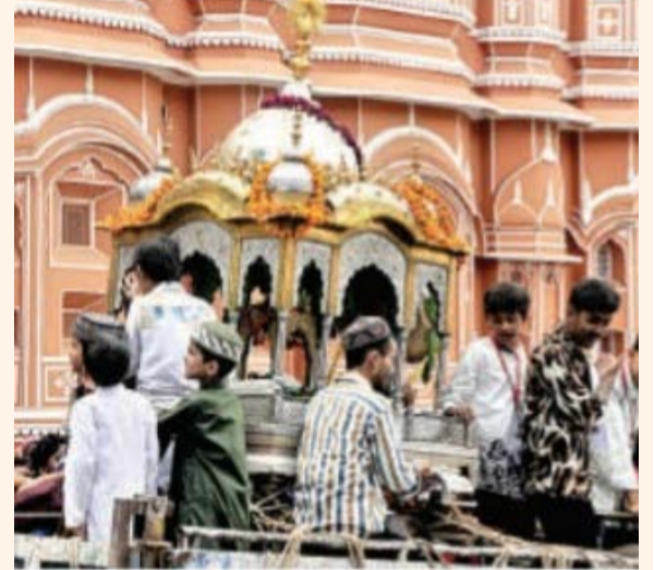
सोने-चांदी का ताजिया।